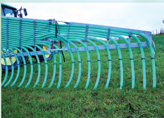
Slangeavstand fra 13-30 cm.