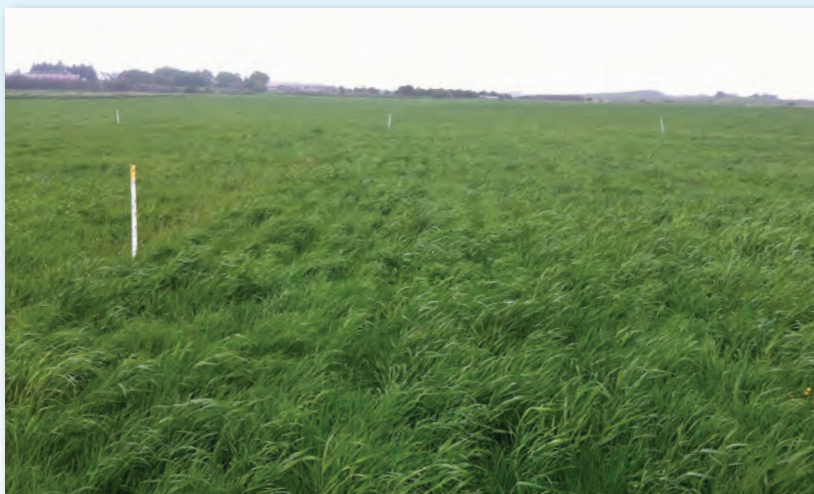
Vedlikehold av eng. Våtsådd med raigras.