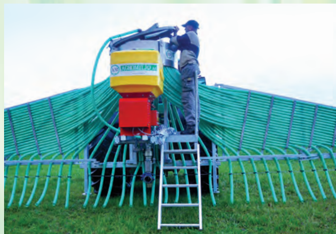
Unik og patentert fordelerhus. Enkelt vedlikehold.