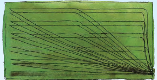
Kjøremønster ved bruk av vogn.