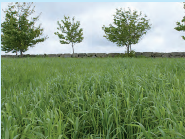
Bugnende grasmark etter spredning med stripespreder