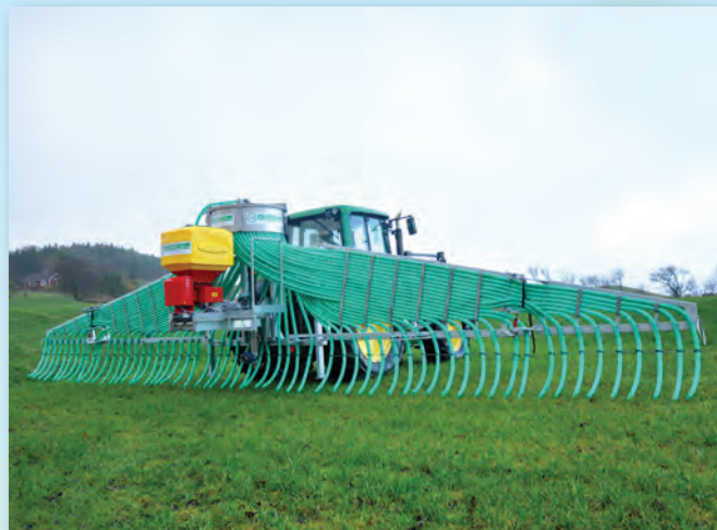
Viser stripespreder med 60 utløp