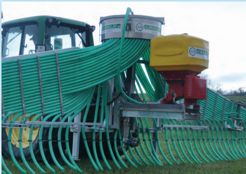
Stripespreder med såmaskin og 60 utløp.

Utstyret har høy kapasitet og gjør det enkelt, økonomisk og effektivt å dele med flere naboer.