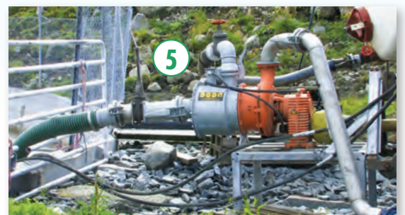
Innblanding av vann direkte i gjødselstrømmen.