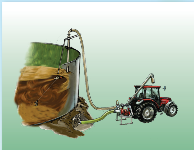
Røredyse og pumpe