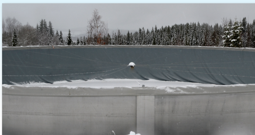
Duk over kant